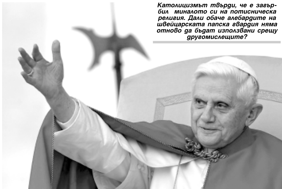
Католицизмът твърди, че е загърбил миналото си на потисническа религия. Дали обаче алебардите на швейцарската папска гвардия нямат отново да бъдат използвани срещу другомислещите?