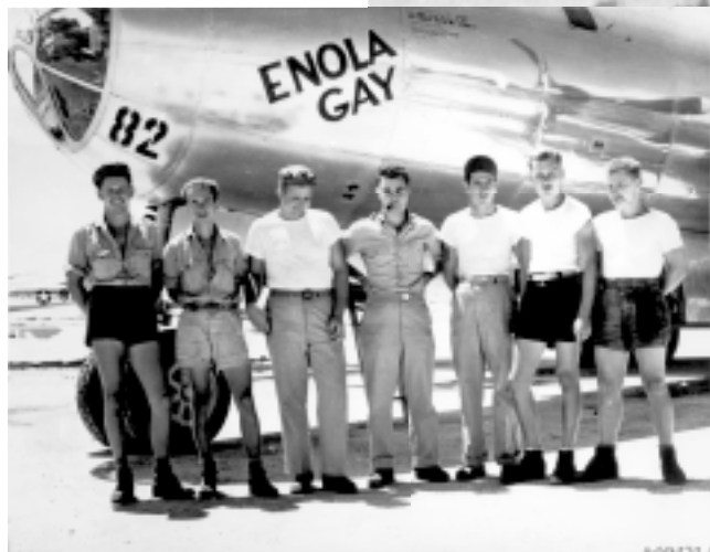
Екипажът на бомбардировача заличил японския град Хирошима. На снимката, запечатала мига от лятото на 1945 г., Пол Тибетс (в средата) изглежда спокоен и самоуверен. Какво ли обаче е почувствал, когато е разбрал, че е пряко отговорен за изпепеляването на 140 хиляди души?

забавна и изцяло негативна. Пастор от унитарно-англиканската църква направил коментар, който вестниците от всички континенти разпространили. Дебатът дали бомбата е необходима и справедлива продължил, но американците вече били съгласни относно едно: смъртта на 140 хиляди японски мъже, жени и деца не била нещо смешно. Сякаш всеки американец си задал въпроса на Луис: „Боже